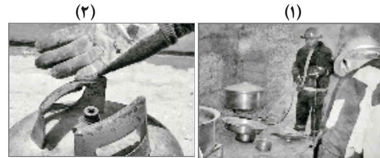
با تشکر از سازمان آتش نشانی و خدمات ایمنی بندرعباس

حدود ساعت ۱۰:۵۸ صبح از سوپاپ کسپول (ایران مورخ ۸۶/۳/۲۸ در گاز) عنوان شده و طبق آشپزخانه منزلی واقع در گزارش به دلیل خرابی سوپاپ از میخ جهت خروج آتش سوزی بوقوع پیوست. علت آتش سوزی نشت گاز خوشبختانه این حادثه فرسوده استفاده نشود .